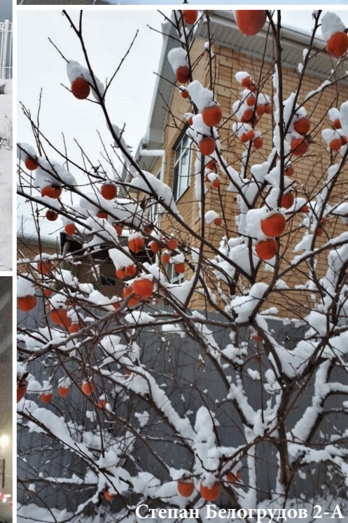
Степан Белогрудов 2-А