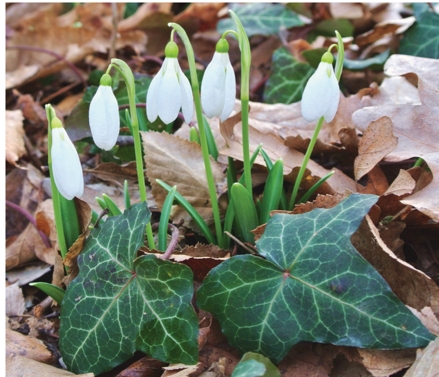
«Анапские подснежники»