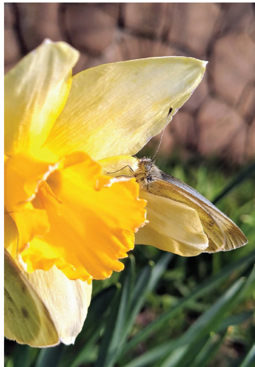
«Весенняя Анапа»