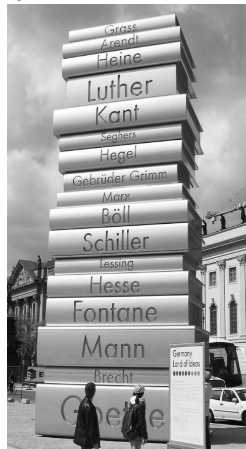
На фото: Памятник любимым книгам в Берлине.

14 февраля каждый ученик принес в гимназию одну книгу, чтобы поменяться ею с другом или соседом. Я тоже принес свою книгу, но получил взамен две книги! Кстати, очень интересные! Это событие, книгодарение, происходило на шестом уроке и заняло все 40 минут. Но зато все успели обменяться книгами и прочитать их!